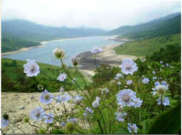
9月頃の野反湖周辺 対岸の地藏峠より秋山郷へ