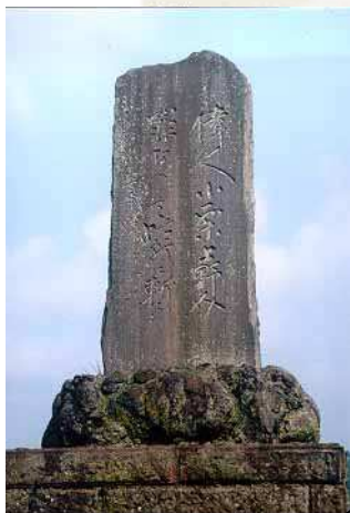
顕彰慰霊碑 鳥川水沼河原